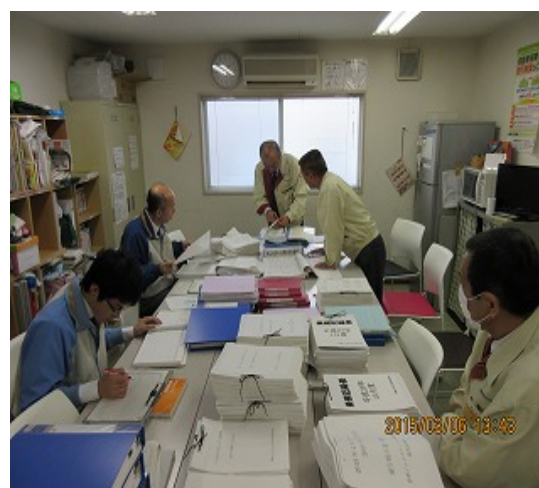
静岡営業所監査風景