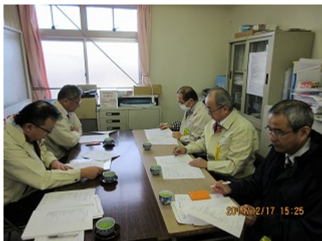
焼津営業所 社長巡視風景