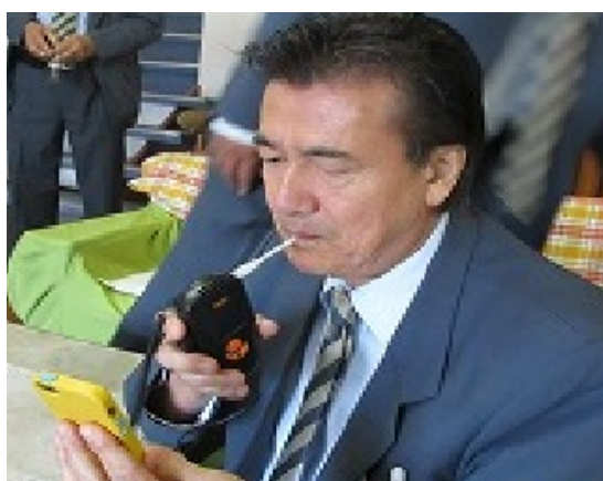
宿泊先でのアルコールチェック風景