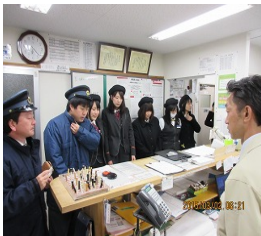
出発時の点呼風景