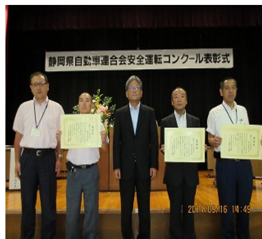
安全運転コンクール表彰