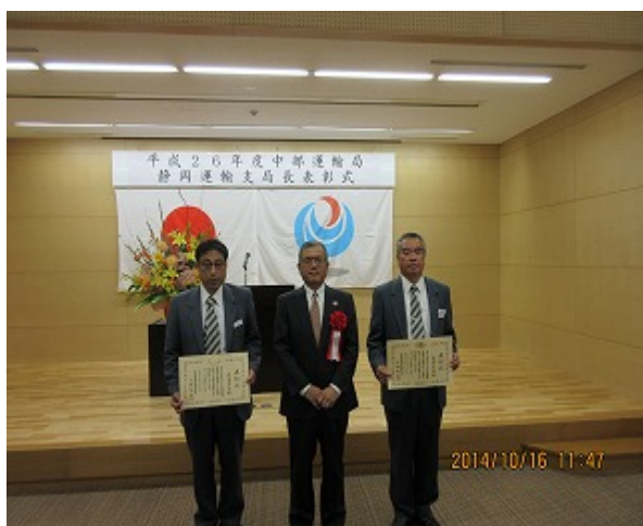
静岡運輸支局局長表彰