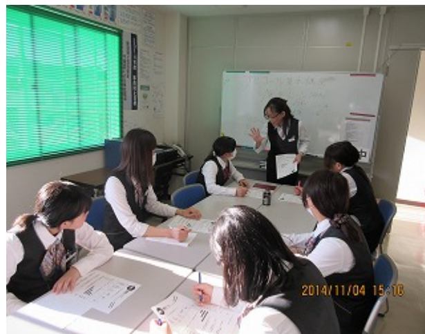
ツアーガイドに対して