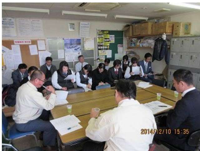
焼津営業所 安全統括管理者の説明

本社：業務管理課同行 営業所：営業所長・副所長・運行係長（点呼執行者）・乗務員（当日の運転士及びツアーガイド）