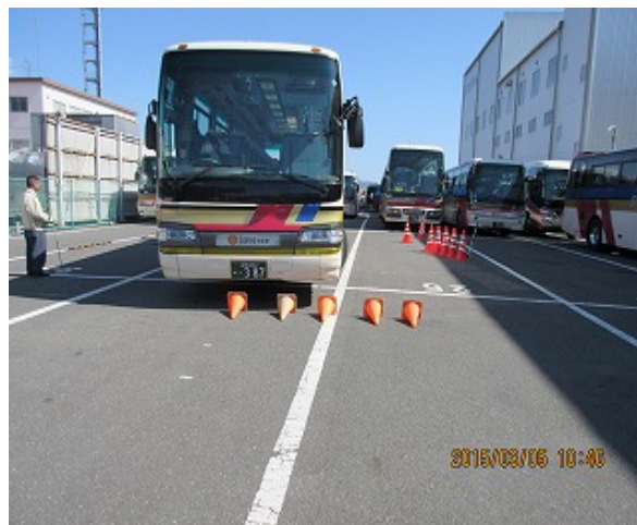
運転席からの視界確認