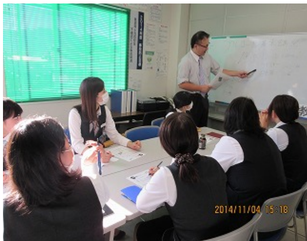
ツアーガイドに対して