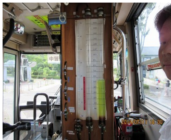
燃費比較シリンダー