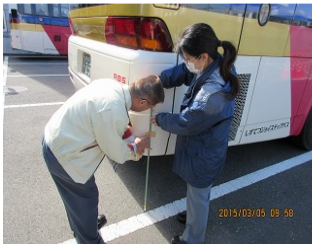
オーバーハング確認