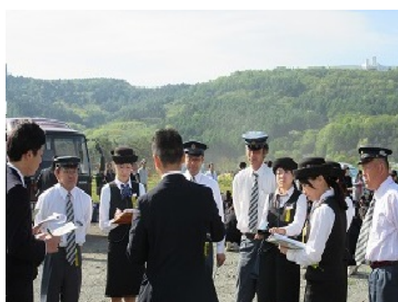
修学旅行のミーティング風景