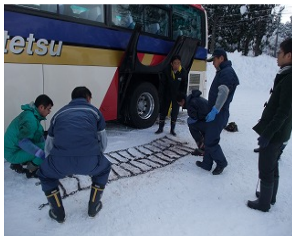
タイヤチェーン着脱訓練