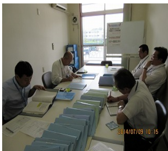
掛川営業所監査風景

運輸支局申請書類控 健康診断・適性診断受診状況 定期点検記録簿 就業規則 3・6協定書 乗務員服務規程 事故・異常気象時対応マニュアル 運行管理者等指導講習手帳 整備管理者研修手帳 苦情・遺失物記録簿 等