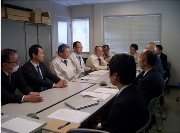
オープニングミーティング