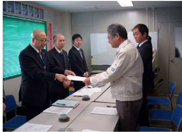
クロージングミーティング