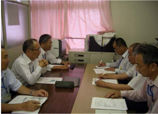
焼津営業所 社長巡視風景