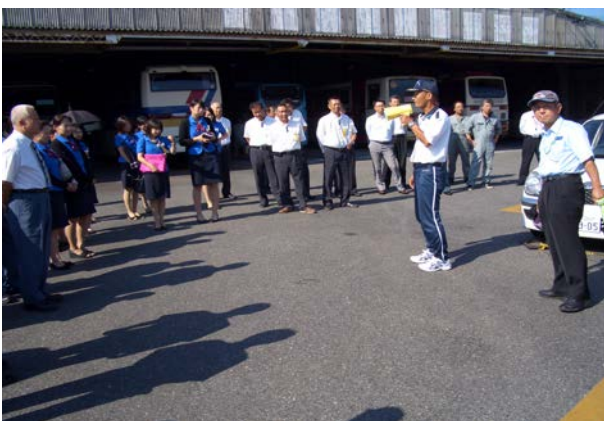
インストラクターからの挨拶