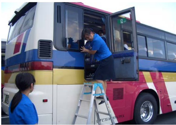
非常口からの脱出避難訓練