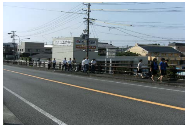
指定の避難場所へ避難