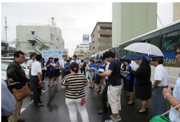
修学旅行出発前のミーティング風景