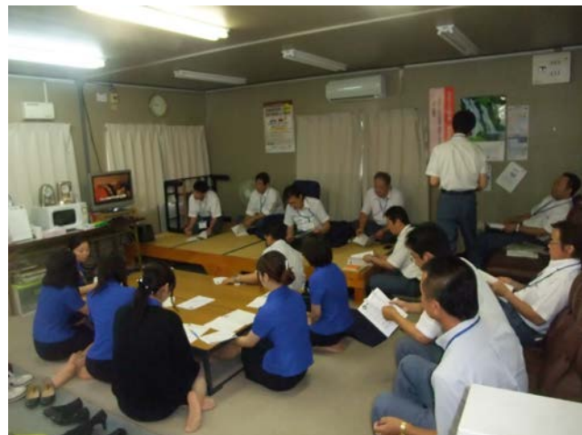
静岡営業所乗務員に対して