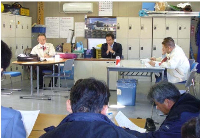
静岡営業所 安全統括管理者の説明