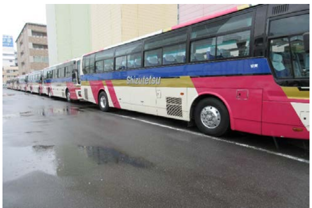
修学旅行 静岡駅南口配車風景