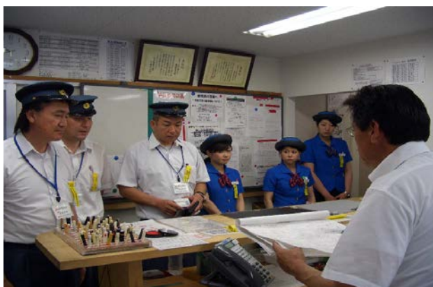
出発時の点呼風景