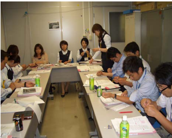
営業部営業社員に対して