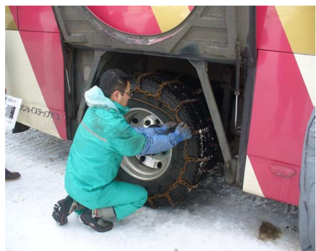
タイヤチェーン着脱訓練